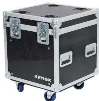
100-0306 Flight case de type malle sans rangement (60 x 60 x 60 cm)